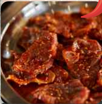
BULGOGI DE CERDO PICANTE CERDO MARINADO CON SALSA DE SOYA COREANA PICANTE 매운돼지불고기 MARINATED SPICY PORK WITH KOREAN SOY SAUCE