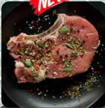
CORTE DE CERDO CHULETA DE CERDO 돼지 스테이크 PORK STEAK