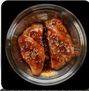
POLLO BULGOGI FAJITA DE POLLO MARINADO EN SALSA BULGOGI 치킨 불고기 BULGOGI CHICKEN