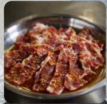
BULGOGI DE CERDO CERDO MARINADO CON SALSA DE SOYA COREANA 돼지불고기 MARINATED PORK WITH KOREAN SOY SAUCE