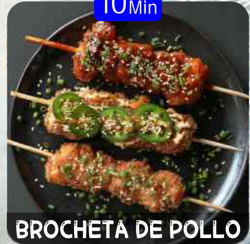
BROCHETA DE POLLO