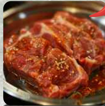
GALBI DE CERDO PICANTE COSTILLA DE PUERCO MARINADO PICANTE 매운돼지갈비 MARINATED SPICY PORK RIBS