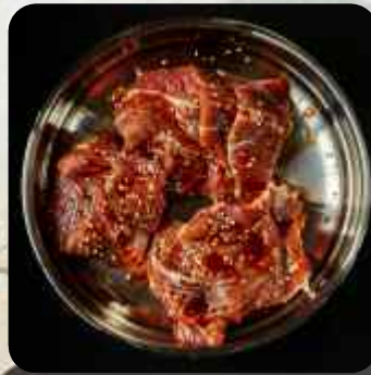
GALBI DE CERDO COSTILLA DE PUERCO MARINADO 돼지양념갈비 K-SAUCE MARINATED PORK