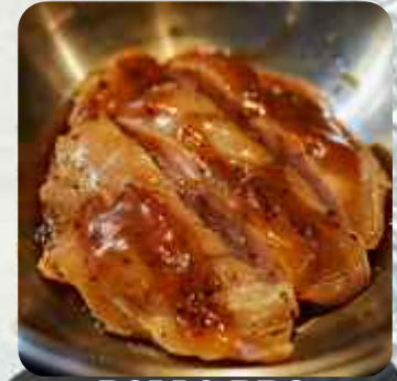
POLLO BBQ FAJITA DE POLLO MARINADO EN SALSA BBQ 바베큐 닭갈비 BBQ CHICKEN