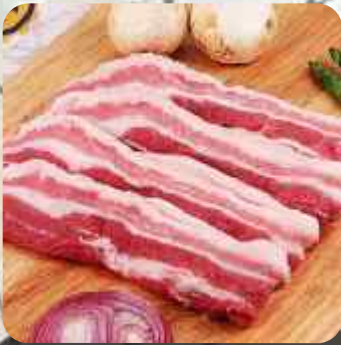
SAM-GYEP-SAL TOCINETA FRESCA DE CERDO 삼겹살 FRESH PORK BELLY