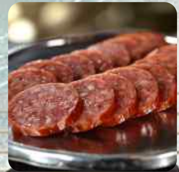
SALCHICHA POLACA SALCHICHA POLACA AHUMADA 소세지 SAUSAGE