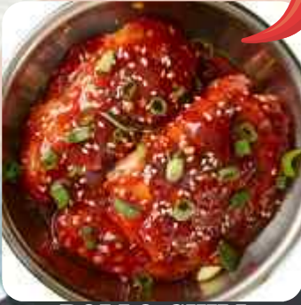
POLLO CHILI MARINADO EN SALSA CHILI 매운 닭갈비 MARINATED SPICY CHICKEN