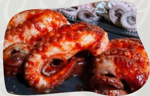
PULPO PICANTE 매운문어 SPICY GRILLED OCTOPUS