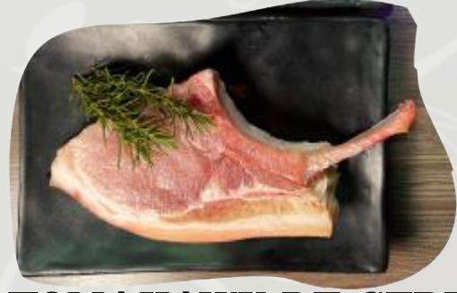
TOMAHAWK DE CERDO 돈마호크 PORK TOMAHAWK