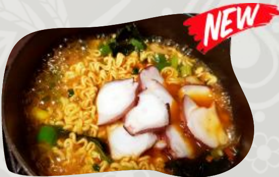
KRAKEN RAMYUN 크라켄 라면 RAMEN CON PULPO KRAKEN RAMYUN