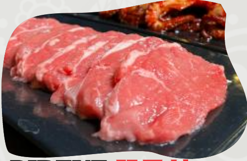
RIBEYE 꽃등심 RIBEYE STEAK