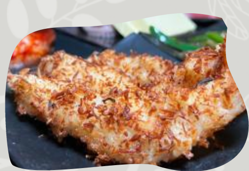
CAMARON FRITO CON COCO 코코넛 새우 튀김 FRIED COCONUT SHRIMP