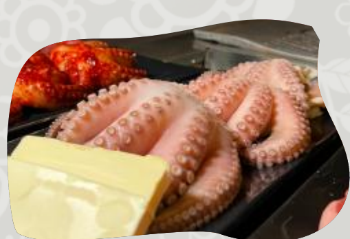
PULPO 문어버터구이 PULPO A LA MANTEQUILLA GRILLED BUTTER OCTOPUS