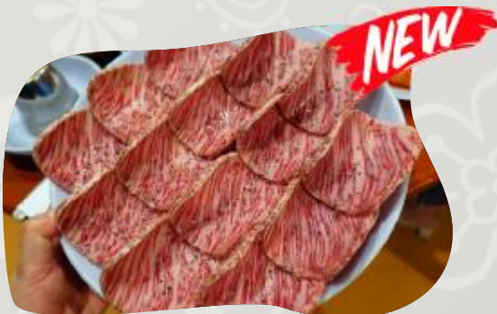
LENGUA DE RES 우설 LENGUA DE RES REBANADA BEEF TONGUE