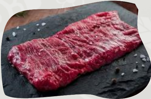
ARRACHERA 안창살 BEEF THIN SKIRT